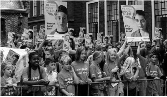
do. 11 jan. 2018