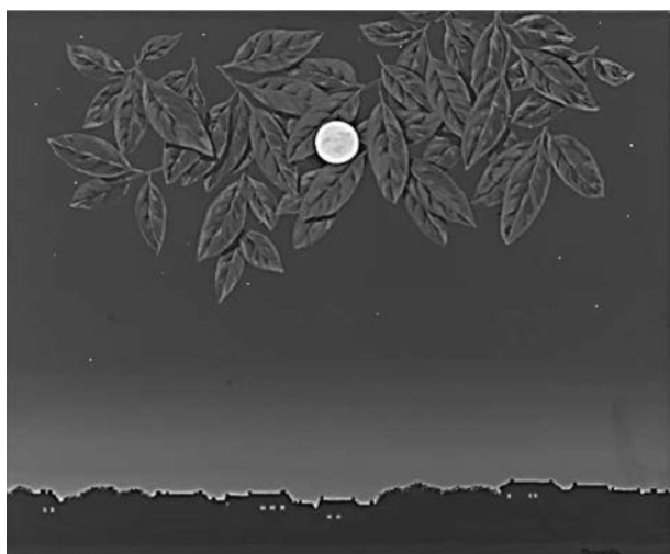
René Magritte, La Page blanche (Het onbeschreven blad), 1967, olie op doek, 54 x 65 cm