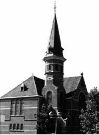
Noorderkerk, Amsterdamseweg 9 http://ede.protestantsekerk.net