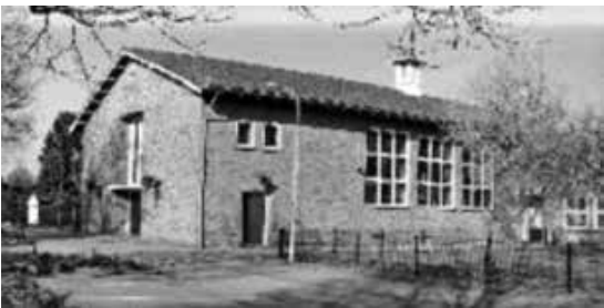
Taborkerk, Prinsesselaan 8, www.taborkerk.nl