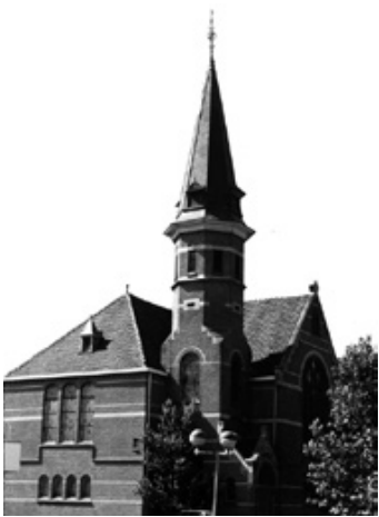
Noorderkerk, Amsterdamseweg 9 http://ede.protestantsekerk.net