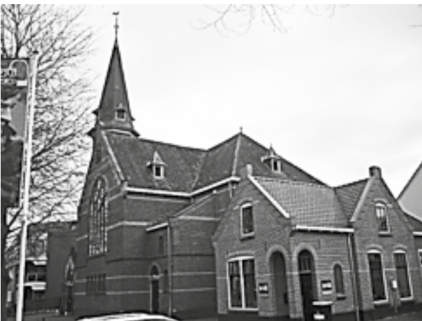
Noorderkerk, Amsterdamseweg 9 http://ede.protestantsekerk.net